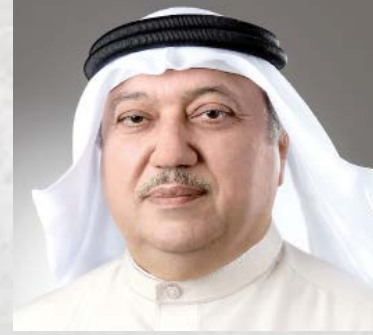
سعادة البروفيسور يوسف عبدالغفار رئيس الهيئة الاستشارية للاتحاد الدولي للمسؤولية المجتمعية - عميد برنامج السفراء الدوليين للمسؤولية المجتمعية مملكة البحرين