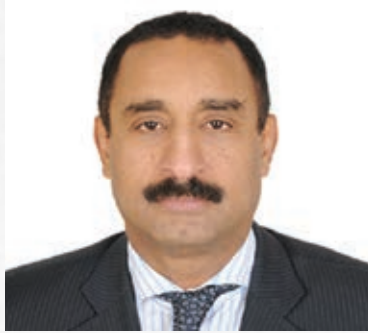
سعادة الدكتور هاشم سليمان حسين رئيس مكتب ترويج الاستثمار والتكنولوجيا التابع لمنظمة الأمم المتحدة للتنمية الصناعية (اليونيدو) السفير الدولي للمسؤولية المجتمعية مملكة البحرين