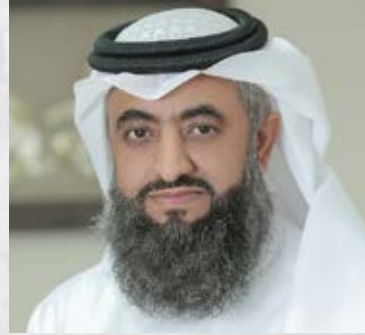
سعادة الدكتور عبدالله الزهراني خبير تطبيقات التنمية المستدامة المملكة العربية السعودية