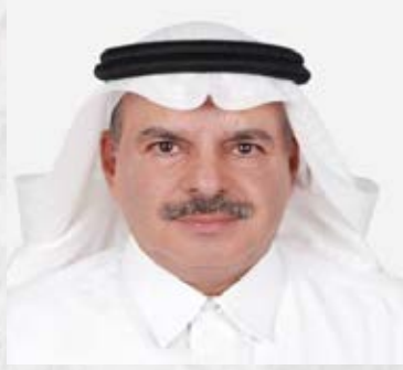
سعادة الدكتور سعدون السعدون رئيس مجلس الإدارة مجلس الجمعيات الأهلية المملكة العربية السعودية