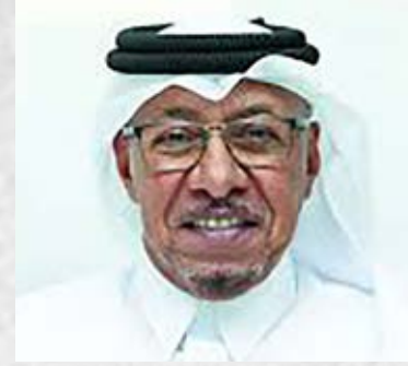
سعادة الدكتور سيف بن علي الحجري مؤسس ورئيس برنامج أصدقاء الطبيعة السفير الدولي للمسؤولية المجتمعية دولة قطر