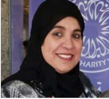
معالي الشبيخة لمياء بنت محمد آل خليفة رئيسة مجلس إدارة جمعية النور للبر السفير الدولي للمسؤولية المجتمعية مملكة البحرين