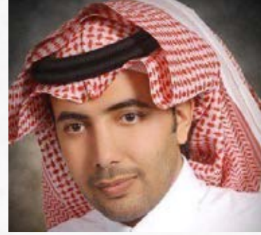
سعادة الأستاذ سعود بن حسين السبيعي رئيس مجلس إدارة جمعية المسؤولية المجتمعية المملكة العربية السعودية