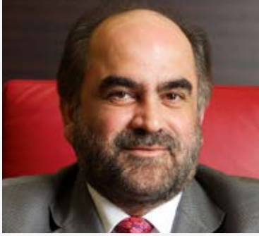
سعادة الدكتور عبدالرحمن جواهري الرئيس التنفيذي لشركة نفط البحرين «بابكو» السفير الدولي للمسؤولية المجتمعية مملكة البحرين