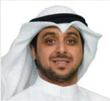
سعادة المستشار حمد الهولي رئيس مجلس إدارة جمعية المعلمين دولة الكويت