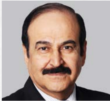
سعادة الدكتور عبد الحسين بن علي ميرزا رئيس هيئة الطاقة المستدامة السفير الدولي للمسؤولية المجتمعية مملكة البحرين