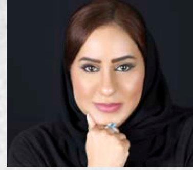
سمو السيدة الدكتورة بسمة آل سعيد السفير الدولي للمسؤولية المجتمعية سلطنة عمان