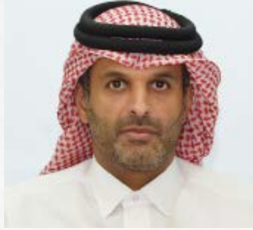
سعادة الشيخ الدكتور ثاني بن علي بن سعود آل ثاني محامي وعضو مجلس إدارة مركز قطر الدولي للتوفيق والتحكيم السفير الدولي للمسؤولية المجتمعية دولة قطر