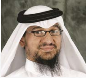
سعادة الدكتور خالد محمد مفتاح أكاديمي وخبير في مجال المسؤولية المجتمعية دولة قطر