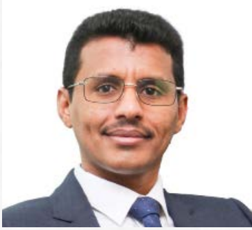
سعادة الدكتور صالح مبارك بازيد الرئيس التنفيذي لمؤسسة نماء الدولية مملكة ماليزيا