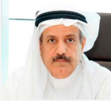
سعادة الأستاذ عدنان أحمد يوسف السفير الدولي للمسؤولية المجتمعية مملكة البحرين