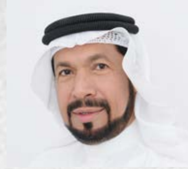
سعادة الدكتور صلاح بن علي محمد عبد الرحمن وزير وبرلماني سابق السفير الدولي للمسؤولية المجتمعية مملكة البحرين