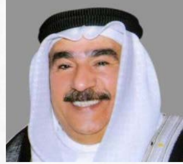
سعادة الدكتور حسن إبراهيم كمال عضو مجلس أمناء المؤسسة الملكية للأعمال المستدامة السفير الدولي للمسؤولية المجتمعية مملكة البحرين