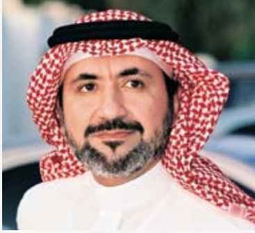
سعادة الدكتور علي شراب العضو الشرفي للصندوق العربي لبحوث المسؤولية المجتمعية المملكة العربية السعودية