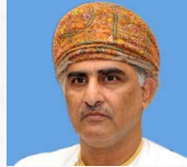
المكرم حاتم الطائي عضو مجلس الدولة العضو الشرقي للاتحاد الدولي للمسؤولية المجتمعية سلطنة عمان