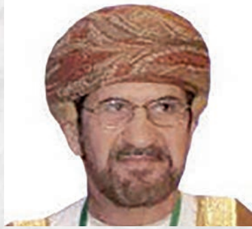
المكرم الشيخ علي بن ناصر المحروقي عضو مجلس الدولة السفير الدولي للمسؤولية المجتمعية سلطنة عمان