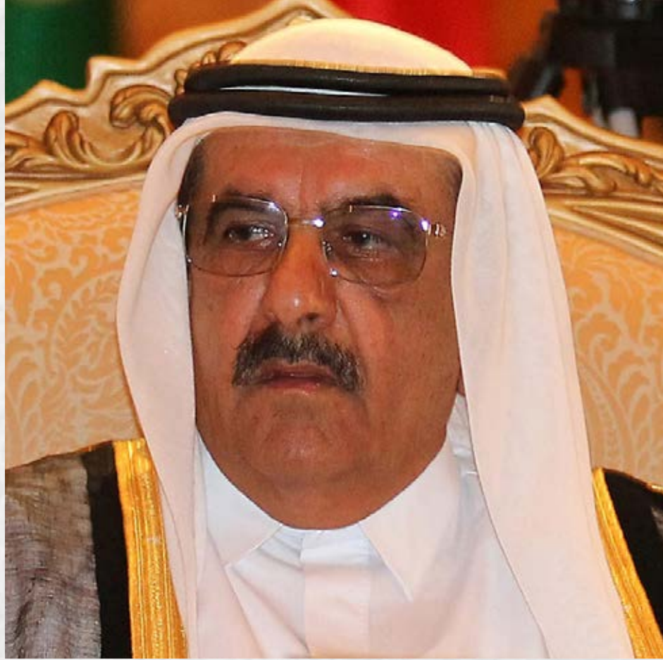
المغفور له بإذن الله سمو الشيخ حمدان بن راشد آل مكتوم نائب حاكم دبي ووزير المالية دولة الإمارات العربية المتحدة (1945 - 24 مارس 2021)