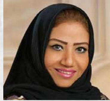
سعادة الدكتورة انتصار أحمد فلمبان رئيسة وكالة استجابة لإدارة الأزمات والكوارث السفير الدولي للمسؤولية المجتمعية المملكة العربية السعودية