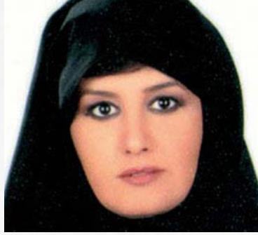
سعادة الشبيخة حصبة بنت خليفة بن أحمد آل ثاني مبعوث الأمين العام لجامعة الدول العربية لشؤون الاغاثة الانسانية دولة قطر