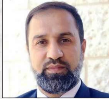
سعادة المستشار مهنا نعيم نجم مؤسس مبادرة نقاء الأسرة سعيدة رئيس منظمة سفراء التنمية العالمية مستشار أسري ومؤلف وكاتب مدير محكمة شرعية بفلسطين دولة فلسطين