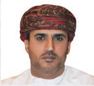
سعادة الشيخ عبد الله بن سالم الرواس رئيس المؤسسة الدولية للتنمية المستدامة السفير الدولي للمسؤولية المجتمعية سلطنة عمان