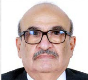
سعادة الأستاذ عبيدي يوسف العبيدي رئيس الإتحاد العربي لتقنية المعلومات والاتصالات السفير الأممي للشراكة المجتمعية مملكة البحرين