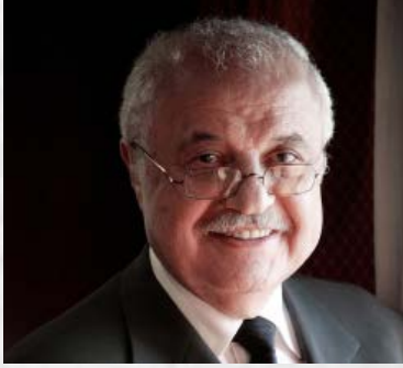
سعادة الدكتور طلال أبوغزالة رئيس مجلس إدارة مجموعة طلال أبو غزالة السفير الدولي للمسؤولية المجتمعية المملكة الأردنية الهاشمية