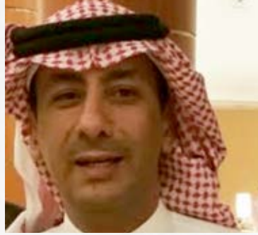
سعادة المستشار فهد بن ناصر القبايع المدير العام لبرنامج معالي الشيخ دعيج بن خليفة آل خليفة لبناء القدرات العربية في مجال الإعاقة المملكة العربية السعودية