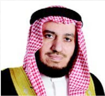
سعادة الشيخ عدنان بن عبدالله القطان رئيس مجلس إدارة جمعية السنابل لرعاية الأيتام السفير الدولي للمسؤولية المجتمعية مملكة البحرين