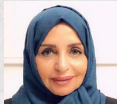
سعادة الدكتورة نعيمة إبراهيم الغنم رئيسة مجلس الخبراء بالشبكة الإقليمية للمسؤولية الاجتماعية المملكة العربية السعودية