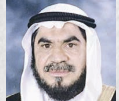
فضيلة الشيخ الدكتور مساعد محمد مندي رئيس مجلس إدارة جمعية التكافل الاجتماعي لرعاية السجناء المعسرین السفير الدولي للمسؤولية المجتمعية دولة الكويت