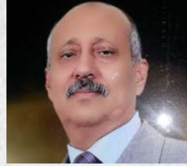
سعادة البروفيسور داود عبدالمك الحداي مدير المعهد العالمي لوحدة المسلمين الجامعة الإسلامية العالمية ماليزيا مملكة ماليزيا الاتحادية