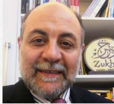
سعادة الدكتور عبد الحليم زيدان رئيس معهد برامج التنمية الحضارية - لبنان مشرف تأسيس منصة ذخر لخدمات تطوير الصناعة الوقفية الجمهورية اللبنانية