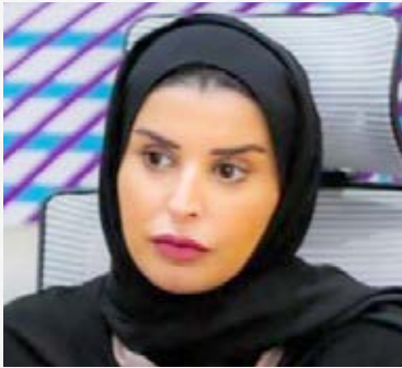
سعادة الأستاذة مريم بنت علي المسند وزير التنمية الاجتماعية والأسرة سفيرة الأيتام دولة قطر