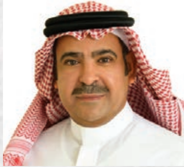
سعادة الدكتور يوسف عثمان الحزيم الأمين العام لمؤسسة العنود الخيرية الرئيس التنفيذي لمؤسسة العنود للاستثمار المفوض الأممي للترويج لأهداف الأمم المتحدة للتنمية المستدامة المملكة العربية السعودية