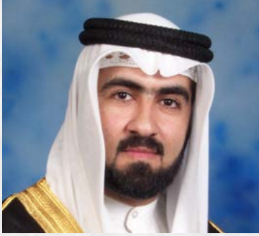
سعادة الدكتور عادل أحمد المرزوقي نائب رئيس مجلس إدارة الشبكة الإقليمية للمسؤولية الاجتماعية مملكة البحرين