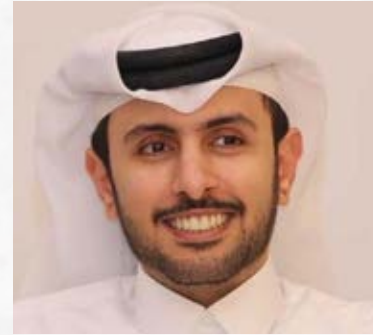
سعادة الدكتور هني خليفة صقر الهتمي دكتور أكاديمي وباحث جامعة قطر دولة قطر