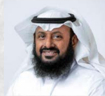
سعادة الدكتور حسن الشريم الأمين العام لمؤسسة السبيعي الخيرية المملكة العربية السعودية