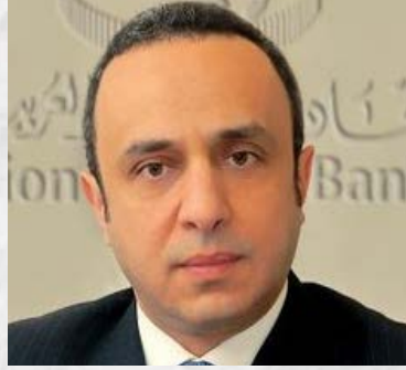
سعادة الأستاذ وسام حسن فتوح أمين عام اتحاد المصارف العربية السفير الدولي للمسؤولية المجتمعية جمهورية لبنان