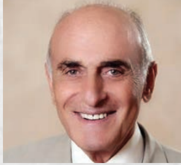
سعادة السيد منيب المصري رئيس مجلس إدارة صندوق ووقفية القدس السفير الدولي للمسؤولية المجتمعية دولة فلسطين