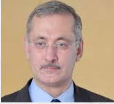
سعادة البروفيسور عودة الجيوسي أستاذ ورئيس قسم الابتكار في جامعة الخليج العربي الباحث في مجال الابتكار المستدام مملكة البحرين