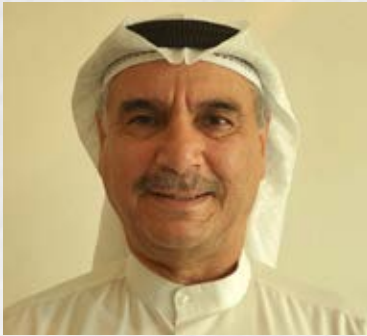
سعادة الاستشاري طبيب أحمد بن محمد الكندري رئيس مركز المعايير والمقاييس المسؤولة الشبكة الإقليمية للمسؤولية الاجتماعية دولة الكويت