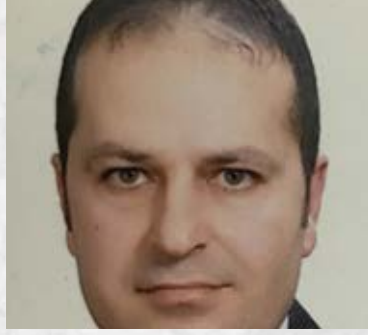
سعادة الدكتور محمد الشياب الأكاديمي والخبير البيئي الدولي العضو الشرفي لشبكة الباحثين العرب في مجال المسؤولية المجتمعية دولة قطر