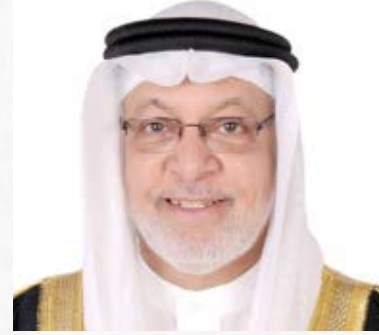
معالي الشيخ دعيج بن خليفة آل خليفة الرئيس الفخري للجمعية الخليجية للإعاقة السفير الدولي للمسؤولية المجتمعية مملكة البحرين