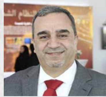
سعادة المستشار صالح الحموري الخبير في مجالات التطوير والتميز المؤسسي والمسؤولية المجتمعية المملكة الأردنية الهاشمية