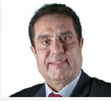
سعادة المهندس فتحي جبر عفانة السفير الدولي للمسؤولية المجتمعية دولة الإمارات العربية المتحدة