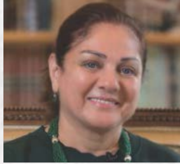
سعادة السيدة مي مخزومي مبعوث دولي خاص لشؤون الدبلوماسية الإنسانية رئيسة مجلس إدارة مؤسسة مخزومي جمهورية لبنان