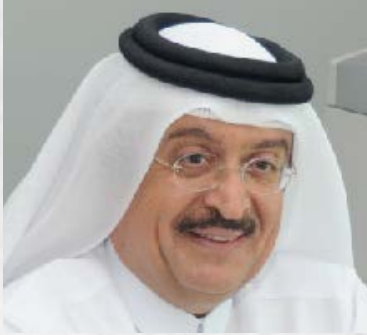
سعادة الدكتور محمد بن سيف الكواري مدير مركز الدراسات البيئية والبلدية السفير الدولي للمسؤولية المجتمعية دولة قطر