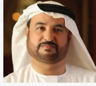
سعادة الأستاذ جمال بن عبيد البح رئيس منظمة الأسرة العربية السفير الدولي للمسؤولية المجتمعية دولة الإمارات العربية المتحدة