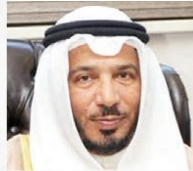
معالي الدكتور عبدالله معتوق المعتوق رئيس الهيئة الخيرية الإسلامية العالمية العضو الشرفي للإتحاد الدولي للمسؤولية المجتمعية دولة الكويت