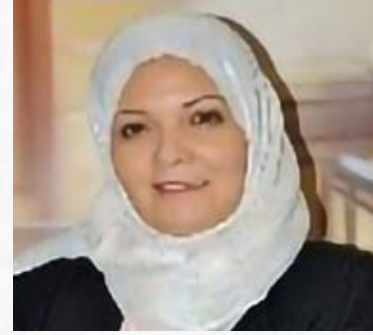
سعادة الدكتورة نجوى بلطيف خبيرة تربية ورئيسة مركز المرأة للمسؤولية المجتمعية الجمهورية التونسية