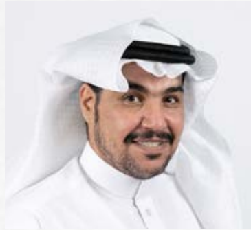
سعادة الدكتور سلمان بن عبد الله المطيري الأمين العام لجمعية رعاية الصحية الأمين العام لمجلس الجمعيات الأهلية المملكة العربية السعودية