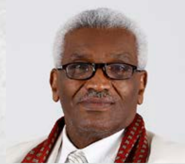
سعادة المستشار الدكتور عبدالقادر ورسمه غالب أكاديمي ومستشار قانوني جمهورية السودان