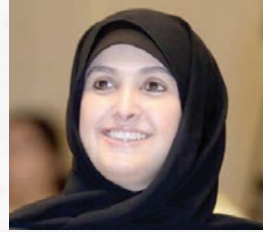
سعادة الشبيخة سهيلة سالم الصباح السفير الدولي للمسؤولية المجتمعية دولة الكويت