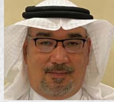
سعادة الدكتور فهد عبدالكريم تركستاني رئيس لجنة البيئة بالاتحاد العالمي للكشاف المسلم المملكة العربية السعودية