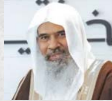
سعادة الشيخ أحمد الصبان مستشار ووكيل وزارة الشؤون الإسلامية (سابقاً) العضو الفخري للشبكة الإقليمية للمسؤولية الاجتماعية المملكة العربية السعودية