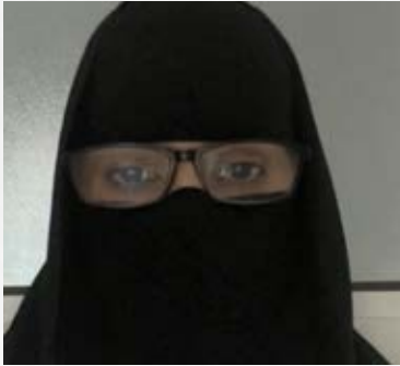
سعادة الدكتورة فاطمة عايض السلمي أستاذ أصول التربية المشارك المملكة العربية السعودية