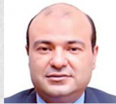
سعادة الدكتور خالد حنفي الأمين العام لاتحاد الغرف العربية جمهورية مصر العربية