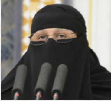
سعادة الدكتورة زينب أبو طالب عضو مجلس الشورى العضو الشرفي للاتحاد الدولي للمسؤولية المجتمعية المملكة العربية السعودية